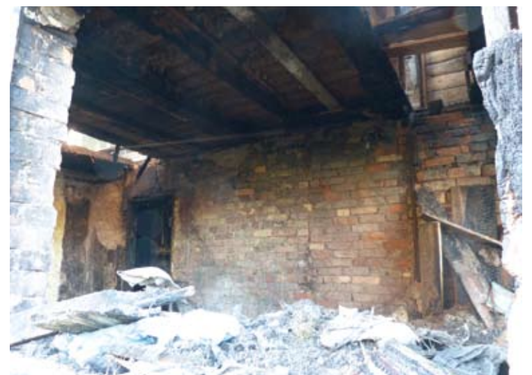
Namas Taikos gatvėje po gaisro.