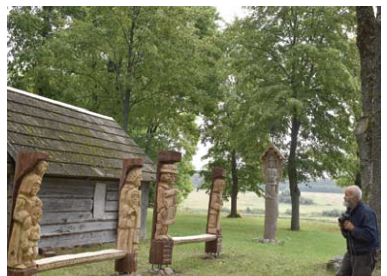
Medžio drožėjas visuomet savo darbus fotografuoja juostiniu fotoaparatu.