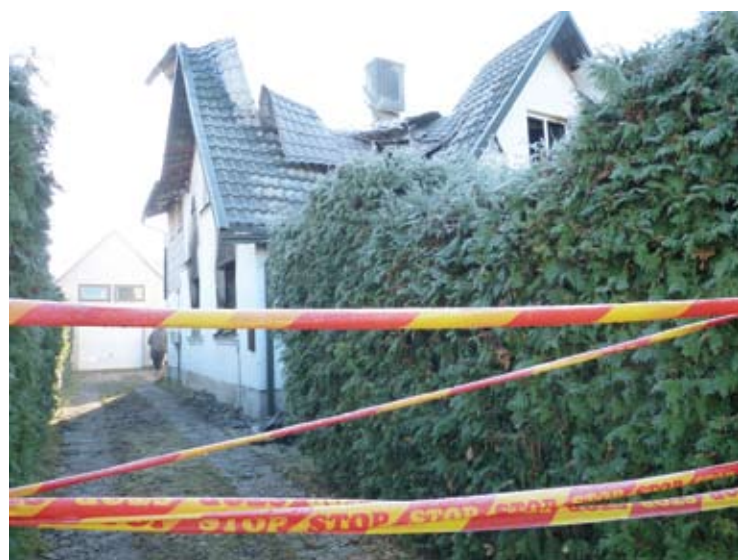
Ugnis suniokojo tvarkingą, renovuotą Taikos gatvės namą.

Naktį iš šeštadienio į sekmadienį sudegė namas Anykščiuose, Taikos gatvėje. Per gaisrą žuvo 1962 m. gimimo vyras.