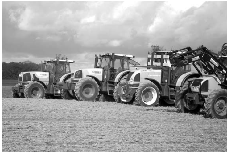
Ši parama ūkininkams yra išties naudinga: investicijos į naują žemės ūkio techniką tampa mažesnės, be to, dirbant su nauja technika, pagerėja darbo našumas.