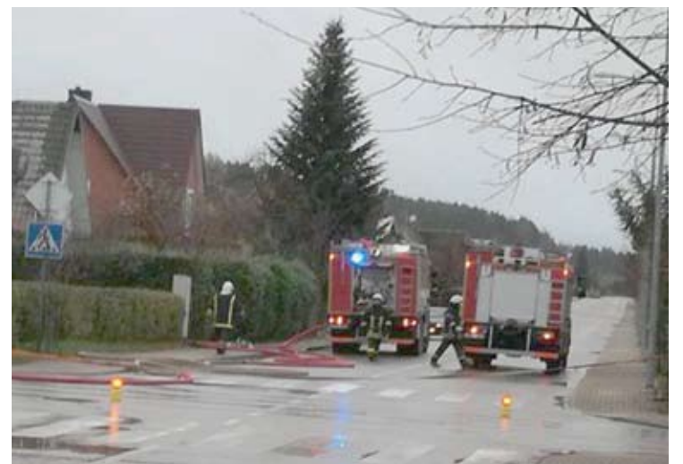
Gaisras kilo gilią naktį. Užgesinus ugnį, prie namo vis dar budėjo ugniagesiai gelbėtojai.

Per pastarąjį mėnesį tai jau antras gaisras Anykščių rajone, nusinešęs žmogaus gyvybę. Spalio 15-ąją gaisre žuvo Šeimyniškių kaimo (Anykščių sen.) gyventojas.