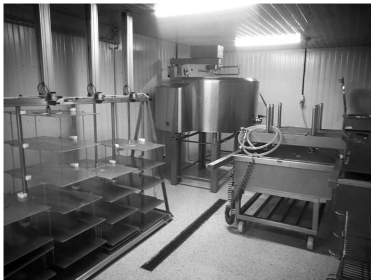
Išimtinė parama skiriama vykdančiesiems žemės ūkio produktų perdirbimo-maisto gamybos veiklą kaimo vietovėse.

Perskirsčius KPP biudžetą, išimtinę laikinai paramai skirta 33 mln. eurų.